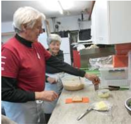
Der „Lehrling“ beim Zubereiten von Thonbrötli ...