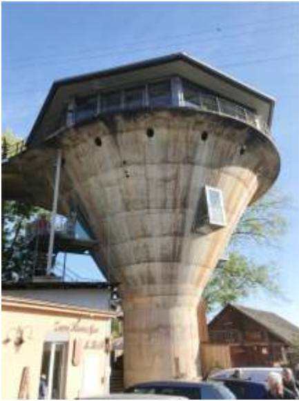
Bergwerksilo von aussen...