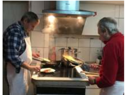
die beiden Köche in vollem Einsatz...

Berücksichtigen Sie bei Ihren Einkäufen unsere Inserenten